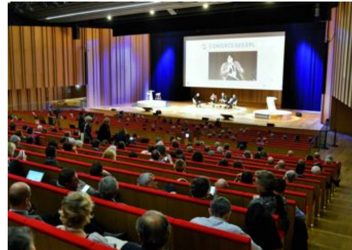
Grand Auditorium du Couvent des Jacobins