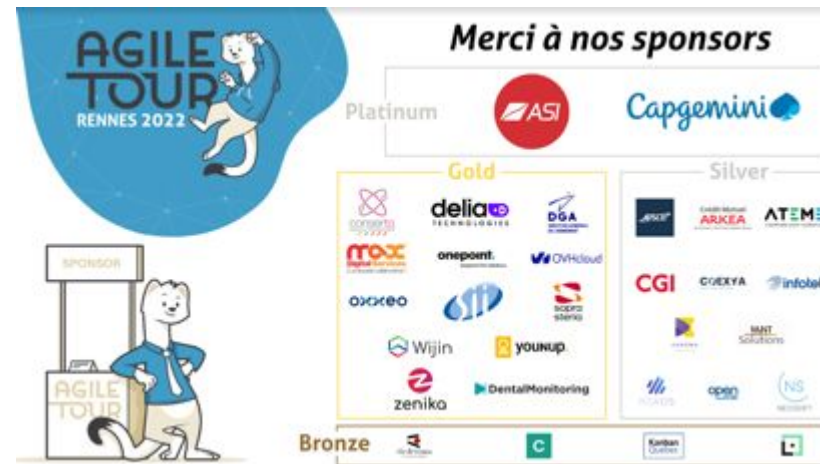
Nos sponsors de l'édition 2022

Chaque niveau de sponsoring permet ensuite de disposer de plus de possibilités d'exploiter le partenariat pour se mettre en avant . Ces options sont présentées au slide suivant.